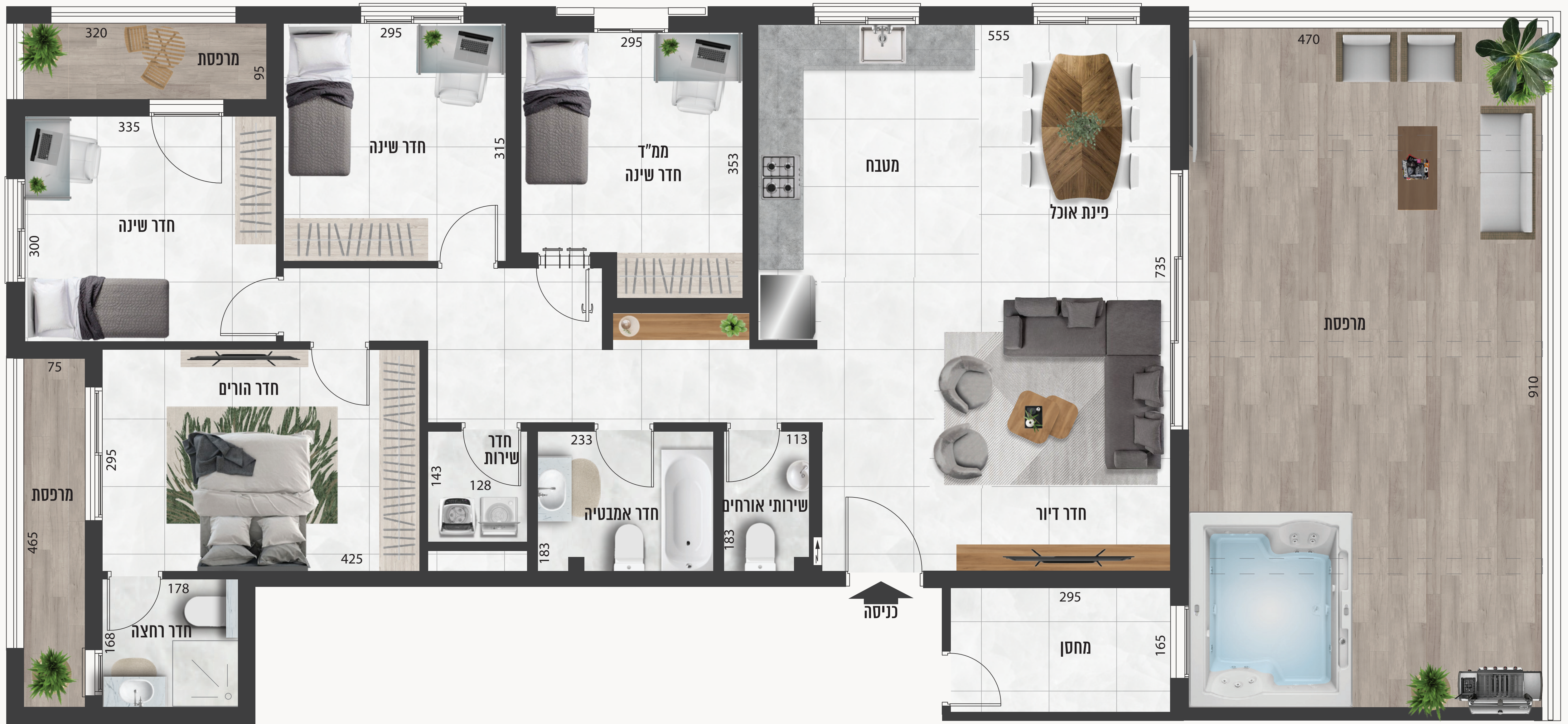
*אפשרות לנקודי בתוספת תשלום