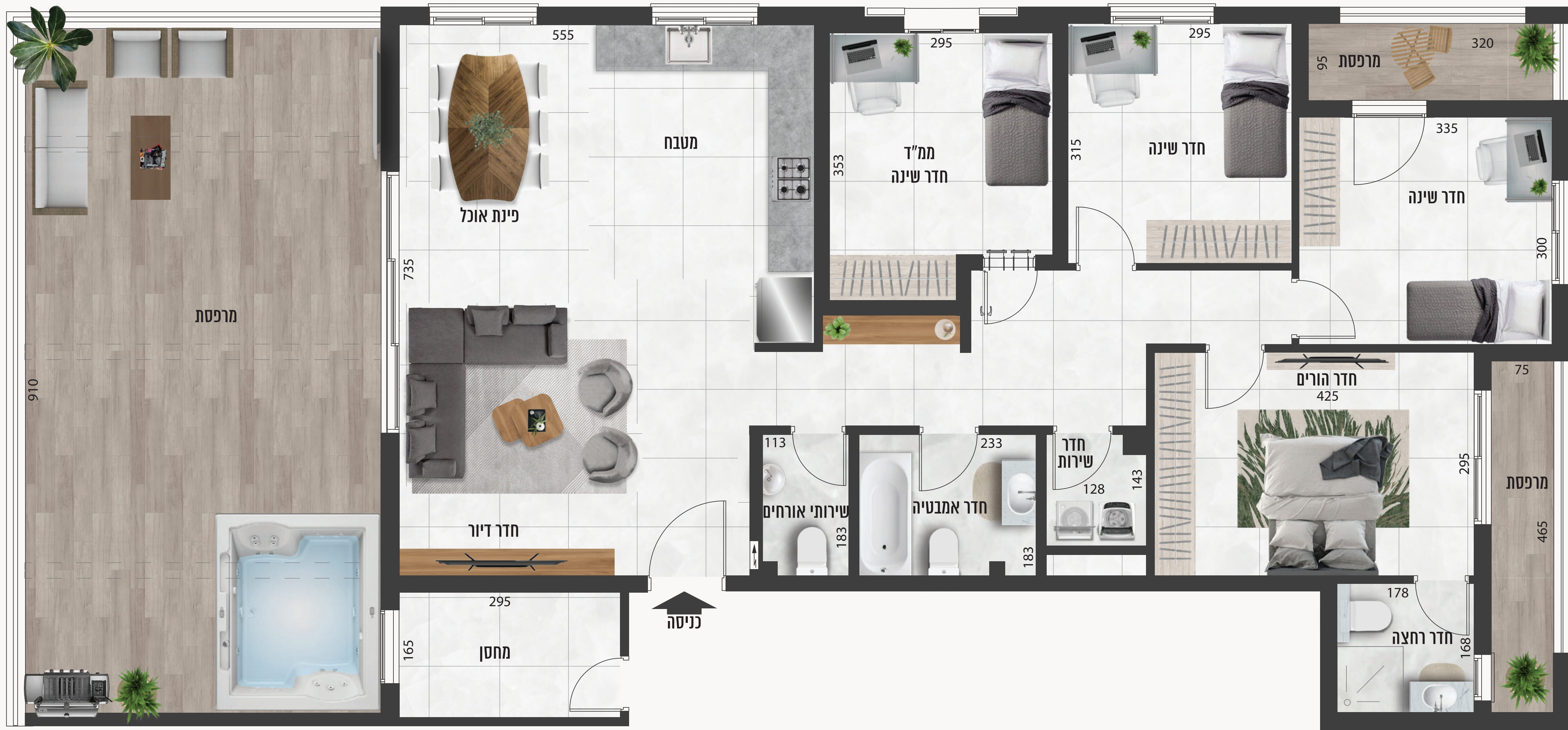
*אפשרות לנקודי בתוספת תשלום